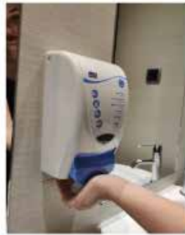
Deposita suficiente jabón en las palmas.