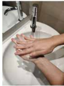
Frota las palmas entre sí,