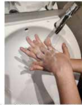
la palma de una mano contra el dorso de la otra, entrelazando los dedos y viceversa,