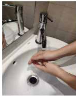
Mójate las manos.