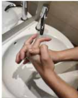
las palmas entre sí, con los dedos entrelazados,