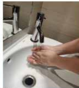
Enjuágate las manos.

Cuando se laven las manos con gel hidroalcohólico no será preciso mojarse las manos