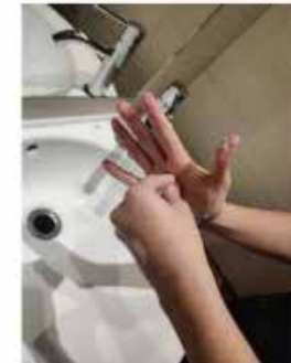
la punta de los dedos contra la palma, rotando,