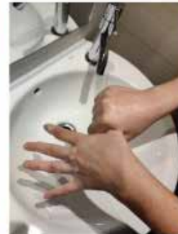
el pulgar con la palma de la mano,