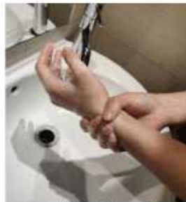
y continua lavando las muñecas.