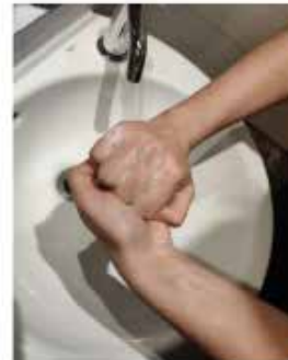
el dorso de los dedos con la palma opuesta,